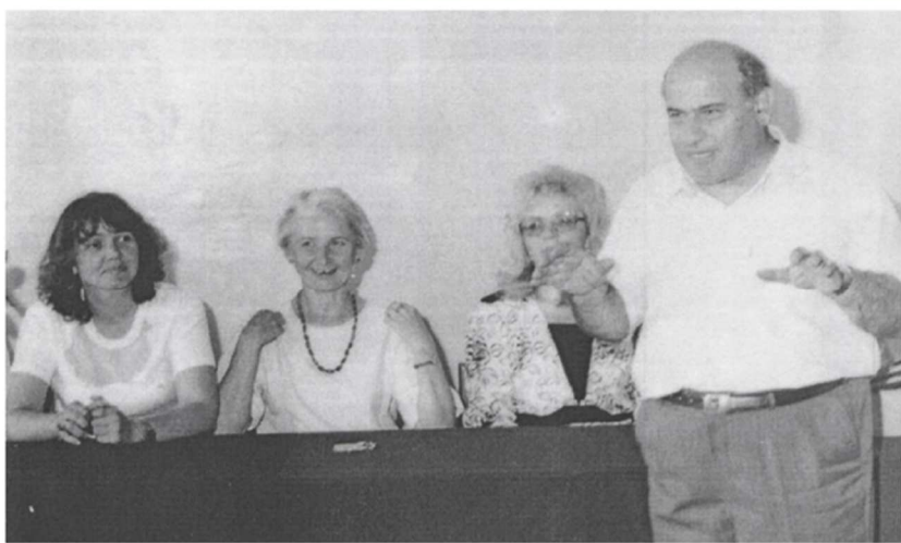
Госэкзамены, г. Тверь, 1982 г.