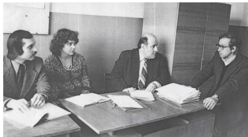
С учениками на кафедре, г. Тверь, 1979 г.